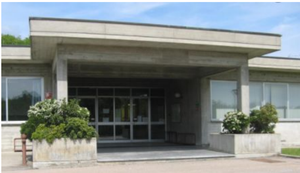
ingresso principale scuola Beregazzo

Il giorno 14 settembre l' entrata sarà alle ore 9.00 .